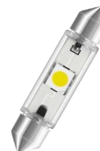
41mm 6000K NF4160 > Zamiennik w nowym portfolio NF6441CW