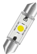
36mm 6000K NF3660 > Zamiennik w nowym portfolio NF6436CW